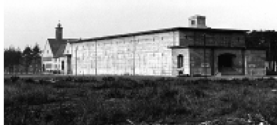
Der in das so genannte Luftschutz-Führer-Sofortprogramm aufgenommene Schönauer Bunker wird nach zweijähriger Bauzeit im April 1942 eingeweiht. Seine Fertigstellung erfolgt durch französische Zwangsarbeiter. Gut 3000 Menschen finden im Alarmfall Platz. Nach Kriegsende quartiert die US-Armee hier bis 1948 Kriegsgefangene ein, danach dient er bis 1954 als Notwohnung für Flüchtlinge und Obdachlose.

In der Hoffnung, sich im Industriezentrum Mannheim eine neue wirtschaftliche Existenz aufbauen zu können, suchen Anfang der 1950er Jahre rund 20 000 Vertriebene, vorwiegend aus der Tschechoslowakei, Schlesien, sowie Ost- und Westpreußen, im Stadtgebiet eine neue Heimat. Auf der vergleichsweise wenig kriegszerstörten Schönau werden 2 500 Vertriebene untergebracht. Zusammen mit rückkehrenden Evakuierten, Flüchtlingen und den Menschen aus der zerstörten Innenstadt steigt die Einwohnerzahl sprunghaft an. Die Wohnungssituation ist äußerst angespannt. Im Rahmen des sozialen Wohnungsbaus errichtet vor allem die GBG neue Wohnblocks. Die vom Wohlfahrtsamt mit dem Allernotwendigsten ausgestatteten Wohnungen werden den Neuankömmlingen zugeteilt. Aus Platzmangel muss von 1948 bis 1954 der Schönauer Bunker als zusätzliches Notquartier herangezogen werden. Mit dem Zuzug vieler Gastarbeiter ab den 1960er Jahren bleiben soziale Spannungen zwischen Nationalitäten und Landsmannschaften nicht aus. Integrativ wirkt bis heute die rege Vereinstätigkeit, welche die kulturellen Belange der unterschiedlichen Bevölkerungsgruppen widerspiegelt.