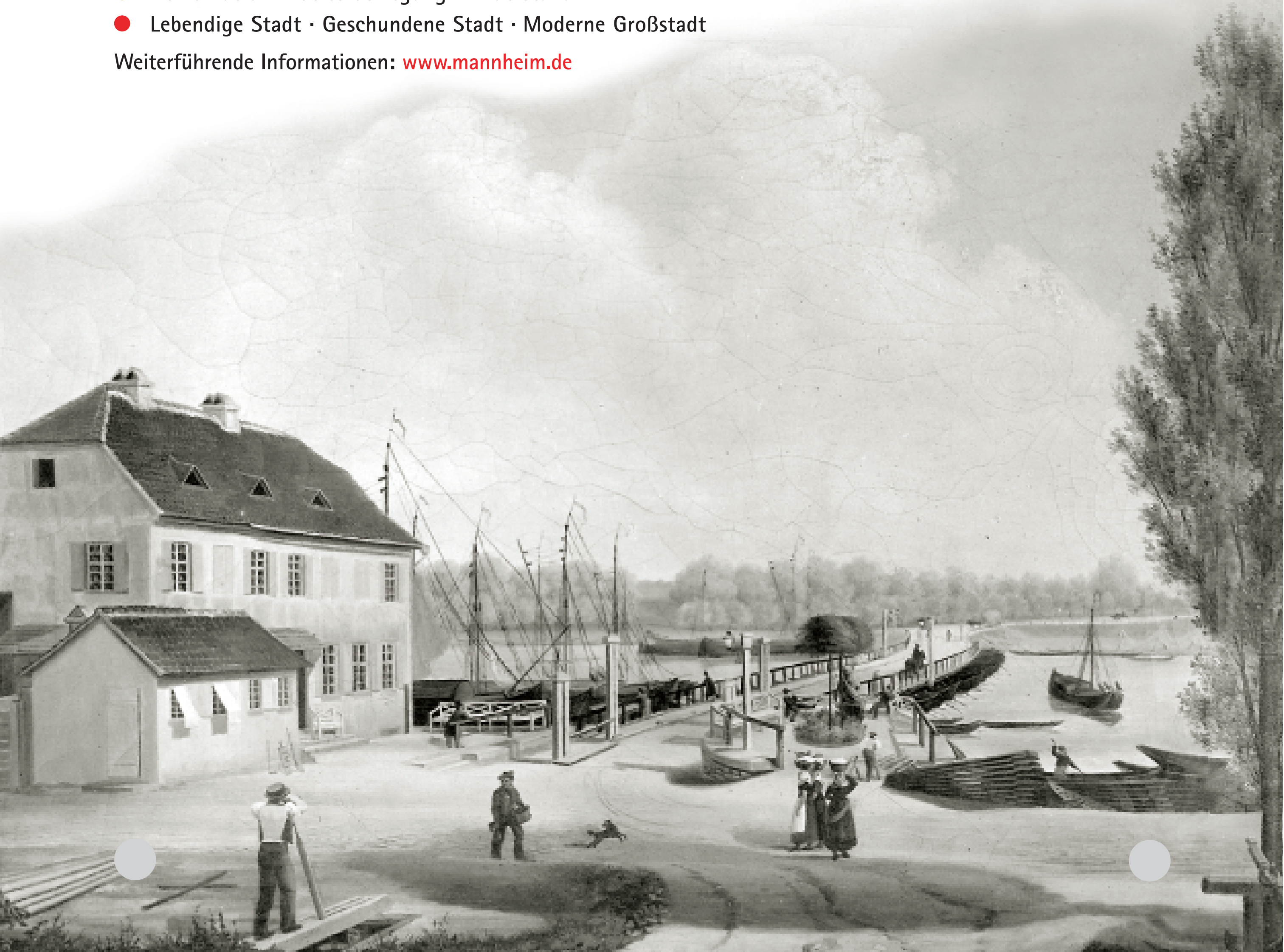
Die Schiffsbrücke am Neckar besteht bis 1845. Dieses Gemälde stammt von 1834.

Weiterführende Informationen: www.mannheim.de