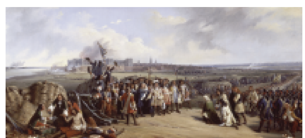
Die Einnahme Mannheims durch französische Truppen unter dem Grand Dauphin, dem Sohn Ludwigs XIV., dargestellt in einer Historienmalerei von Edouard Henri Théophile Pingret aus dem Jahr 1837.