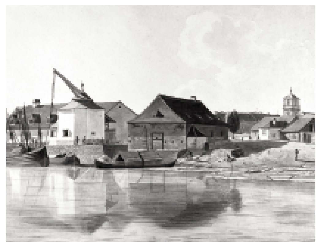
Der Kran am Neckar, um 1830. Der so genannte Neckarlauer, der Schiffsanlegenplatz, zu dem auch der Kran gehört, befindet sich etwas unterhalb der Schiffsbrücke in Richtung Neckarmündung.