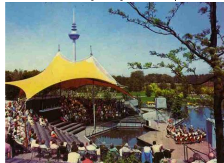
Nr. 4) Seebühne im Luisenpark