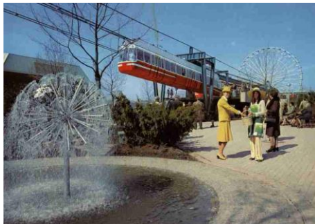
Nr. 3) Hostesse im Herzogenriedpark