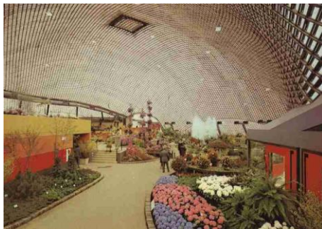
Nr. 1) Blumenschau in der Multihalle

Wir senden Ihnen Ihre Bildwünsche gerne zu. Bitte kontaktieren Sie uns und nennen die entsprechenden Bildnummern.