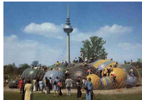
Nr. 2) Ballgebirge Babbelpast