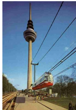
Nr. 8) Aerobus am Fernmeldeturm