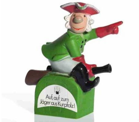
Nr. 9) Jäger aus Kurpfalz als Spardose