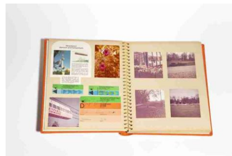
Nr. 6) Privates Fotoalbum BUGA 75