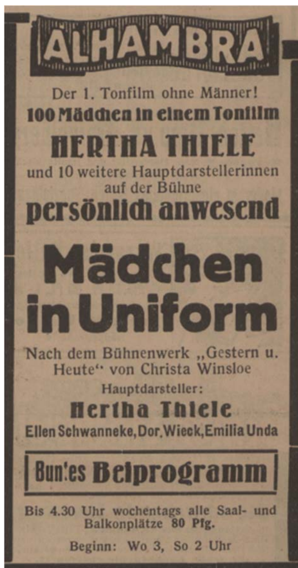
Anzeige im Hakenkreuzbanner (Ausgabe Mannheim), 13.02.1932

Letztere war für Mannheim relativ leicht zu beantworten. Im Hakenkreuzbanner von 1932 fand sich sowohl eine Filmbesprechung als auch die Anzeige des Kinos, 20 in dem der Film in Mannheim zur Erstaufführung kam. Da die Anwesenheit von elf Hauptdarstellerinnen angekündigt wurde, kann davon ausgegangen werden, dass zumindest dem Mannheimer Premierenpublikum seit dieser Zeit eine Reihe von Schauspielerinnen vertraut war. Schwer vorstellbar, dass nicht alle Autogramme gegeben hatten. Hertha Thiele stand im Zentrum des Interesses, noch nicht Dorothea Wieck. 21 Auf die Autorenschaft von Christa Winsloe wurde in der Filmwerbung verwiesen, den Namen der Regisseurin vermisst man allerdings. Aber dieses ‚Schicksal‘ teilte Leontine Sagan mit dem „künstlerischen Leiter des Films“, Carl Froelich. Drei Tage später hatte ein Redakteur, die NS-Presse bevorzugte den Titel Schriftleiter , die Gelegenheit, den Film ausführlich zu beurteilen: