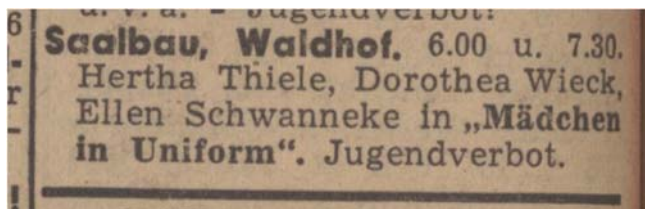
Auszug Hakenkreuzbanner (Ausgabe Mannheim), 20.01.1943

Stichproben (es wird kein Anspruch auf Vollständigkeit erhoben) ergaben, dass es nicht bei dieser einen Wiederaufnahme blieb. Im Mai 1941 tauchte der Film wieder auf. Dieses Mal in einem Vorortkino, wieder in einem nicht zu übersehenden Format, und dann -den Zeitumständen entsprechend- kleinformatiger noch einmal 1943.